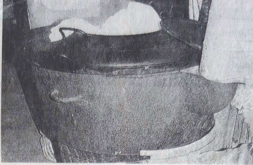
Le ragoût qui mijote pour un millier de convives...

et - Quelque 3 000 visiteurs pour enchante le seizième festival plinn du Danouët