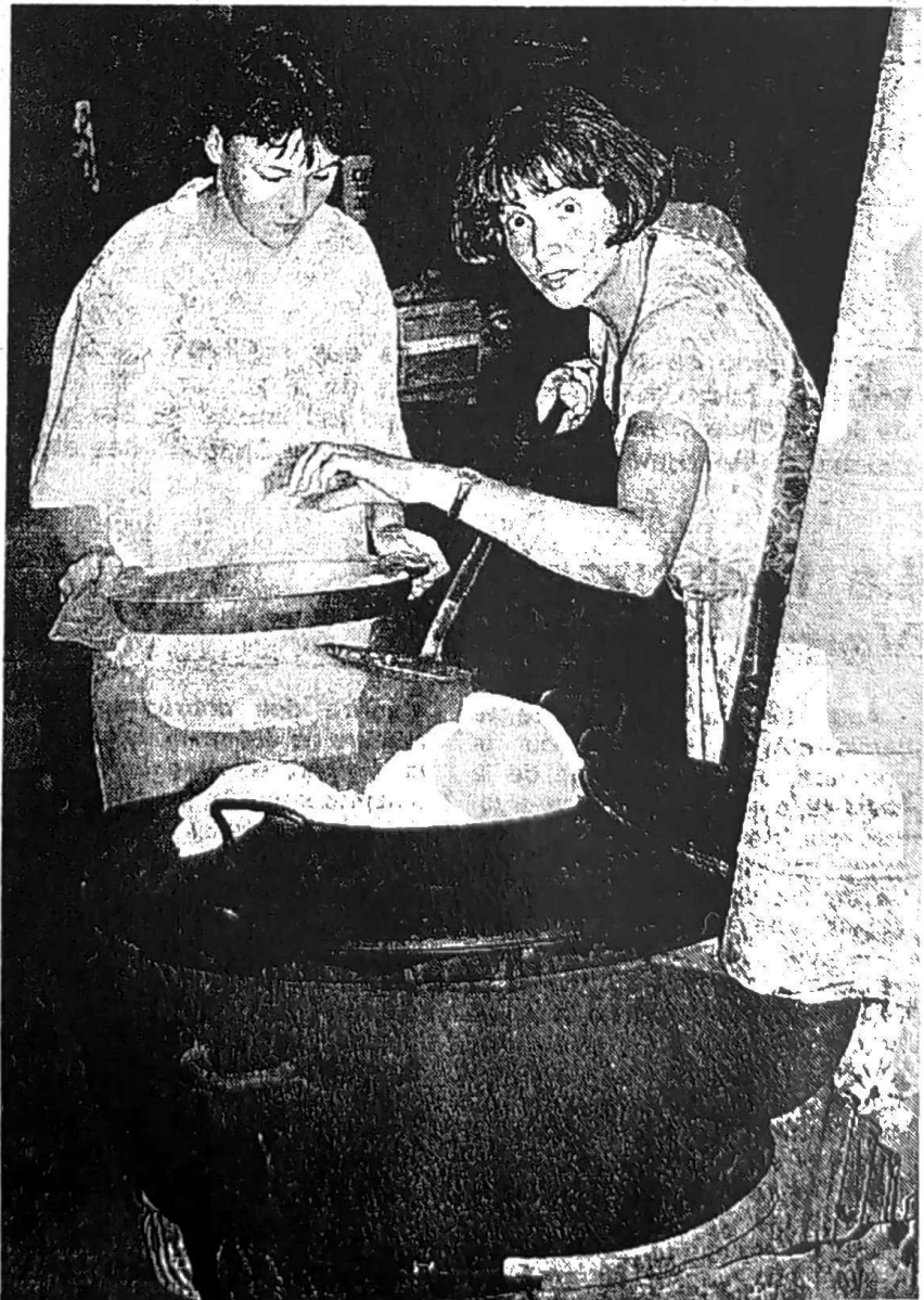
Le ragoût qui mijote pour un millier de convives...