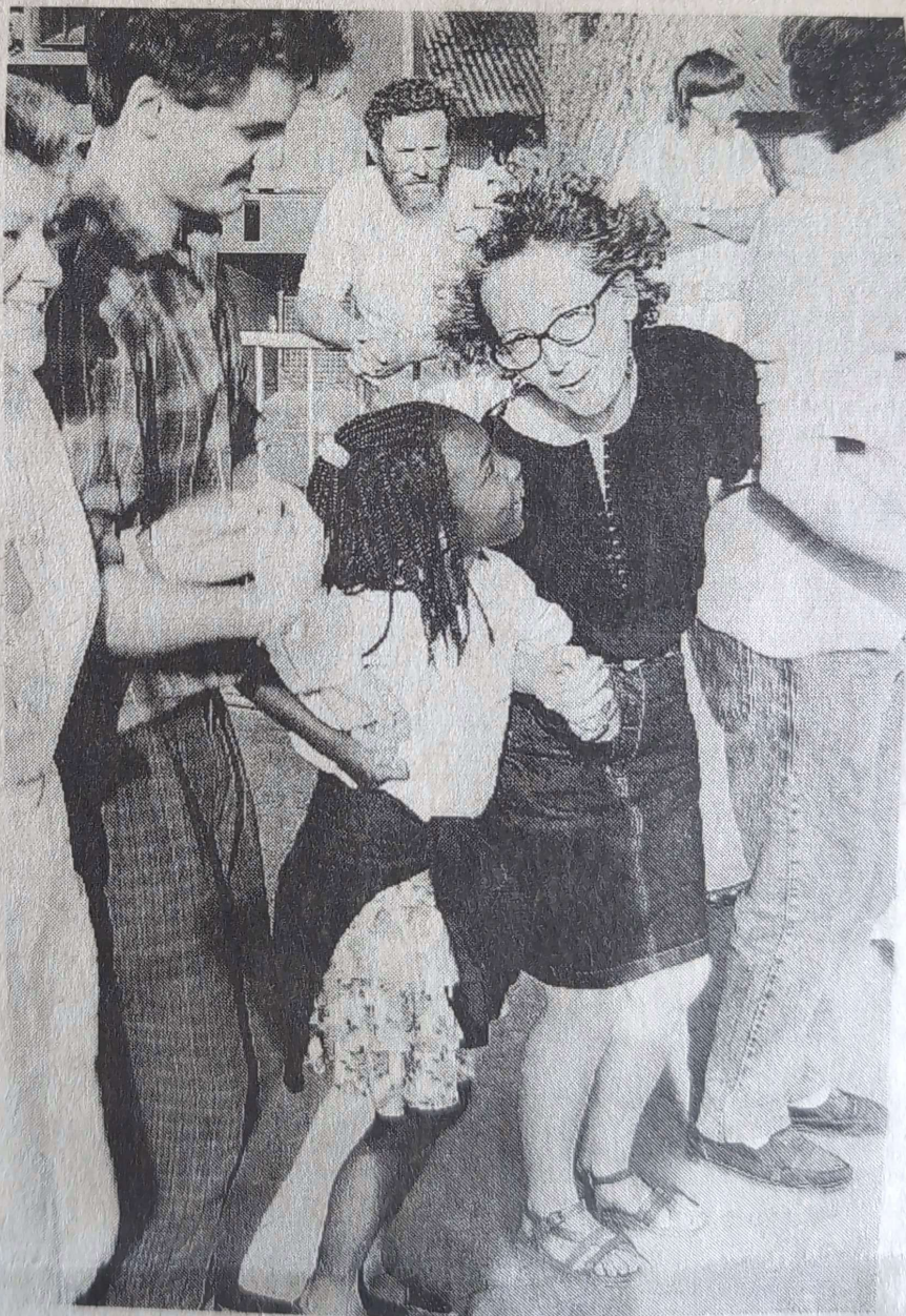
Quelque 3 000 visiteurs pour enchante le seizième festival plinn du Danouët