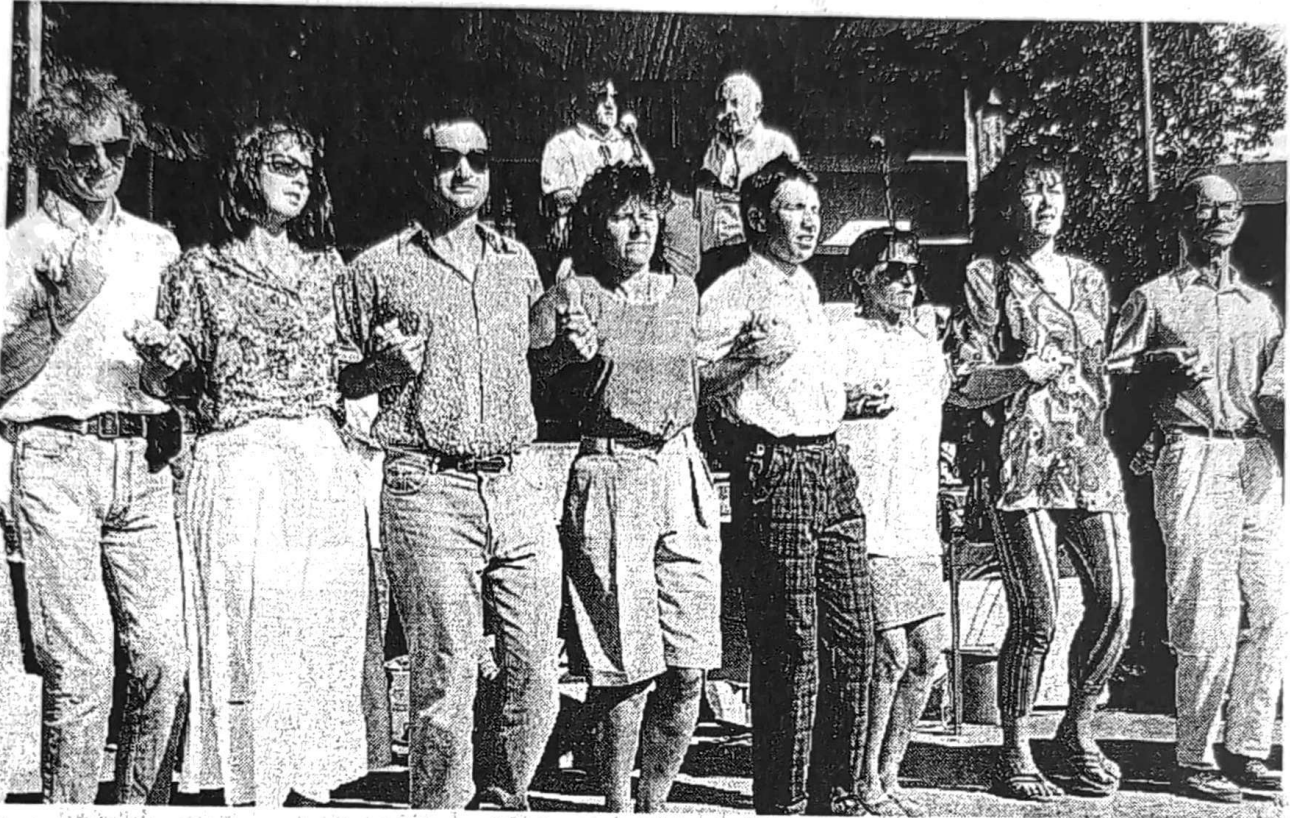
Une danse rude à battre la terre

Le Danouët, avec sa chapelle de granit usé, ses maisons joliment restaurées mais aussi ses ruines envahies par la végétation, ses arbres séculaires et sa place tassée par les longues files de danseurs... Ils étaient quelque 3 000 jeudi à fouler la terre au rythme du seizième festival plinn.