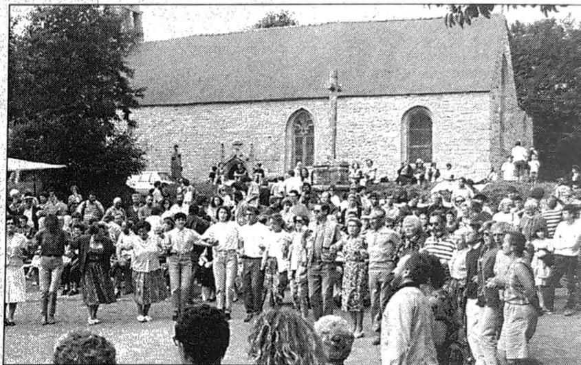
Plinn, polka-plinn... Bourbriac a la tradition à cœur.

Pour les concours « journée de l'enfance », s'inscrire le jour même avant 14 h. Idem pour les concours de groupes musicaux du jeudi. Pour les concours binioukoz, braz-bombarde, accordéon diatonique et clarinette, inscription possible jusqu'au vendredi