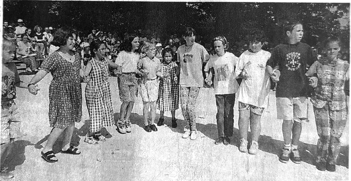
Au-delà de la danse, le festival plinn du Danouët demeure un fort moment de convivialité.

Au-delà de perpétuer la tradition bretonne (les premiers jours sont consacrés à des ateliers), le comité s'attache aussi, depuis 1970, à restaurer la chapelle du lieu.